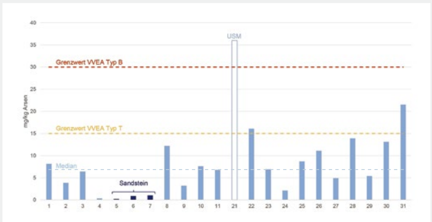
Fig. 2 Arsengehalte in OSM-II-Proben gemäss XRF-Analysen der Eawag. Median über alle 22 Proben (inkl. USM): 7 mg/kg Arsen.

In den Inkubationsversuchen mit Calciumchlorid-Lösung erfolgte dann eine relevante Mobilisierung von Arsen bis zu Konzentrationen > 10 µg/l im Eluat, wenn sowohl eine Kohlenstoffquelle als auch Bodenmaterial als Quelle zusätzlicher Bakterien zugesetzt wurden und so der Übergang zu reduzierenden anoxischen Verhältnissen gefördert wurde (vgl. Fig. 3). Unter diesen Bedingungen war damit eine reduktive Arsenmobilisierung erkennbar. Eine analoge Versuchsreihe mit destilliertem Wasser ergab nur ohne Zusätze erhöhte Arsengehalte bis 12 µg/kg, mutmasslich bedingt durch die Dispersion von kolloidalen Gesteinspartikeln bei niedriger Ionenstärke und/oder den Anstieg des pH-Werts in den alkalischen Bereich (pH ~10). In den übrigen Laborversuchen (Langzeit-Eluattests sowie kurzzeitige Extraktionsversuche mit Calciumchlorid unter oxischen Bedingungen) wurden nur sehr geringe