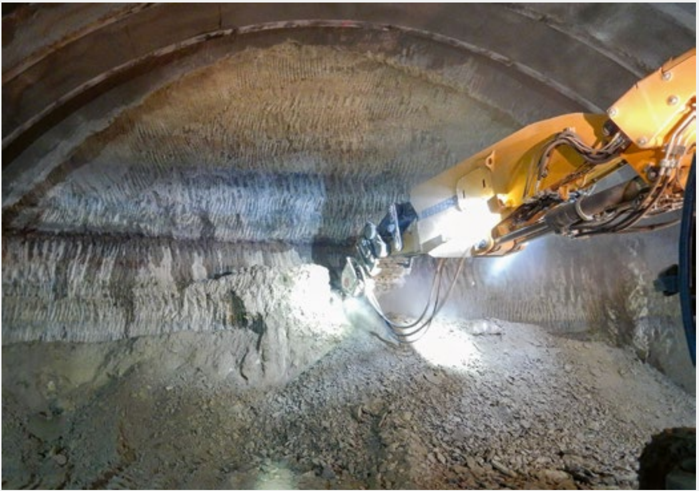
Fig. 1 Maschinell unterstützter Felsvortrieb (MUF) per Teilschnittfräse mit anfallendem «kleinstückigem» Tunnelausbruch.

Ablagerungen typischerweise über bedeutenden Grundwasservorkommen, die als Trinkwasserressource genutzt werden. Da Aufschüttungen für lange Zeit der Durchsickerung mit Niederschlagswasser ausgesetzt werden und der Abstand zwischen Abbaukote und Grundwasserleiter lokal gering ist, besteht ein Risiko, dass allfällig vorhandene Schadstoffe mobilisiert werden und ins Grundwasser gelangen. Eine potenzielle Gefährdung besteht insbesondere bzgl. Arsen, das eher mobil und vergleichsweise toxisch ist. Der Grenzwert der Verordnung des Eidg. Department des Innern EDI über Trinkwasser sowie Wasser in öffentlich zugänglichen Bädern und Duschanlagen (TBDV) liegt bei 10\mu\text{g}/\text{l} .